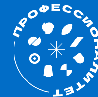
ФОТО- И ВИДЕОСОПРОВОЖДЕНИЕ